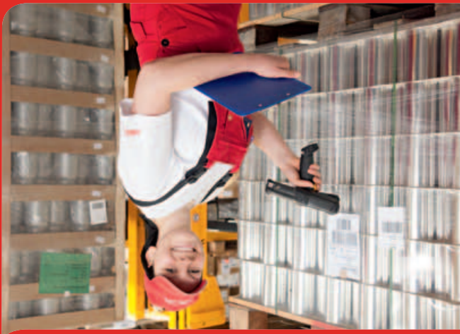
Fachkraft für Lagerlogistik (w/m)