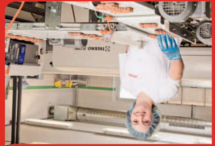
Fachkraft für Lebensmitteltechnik (w/m) Maschinen- und Anlagenführer (w/m)