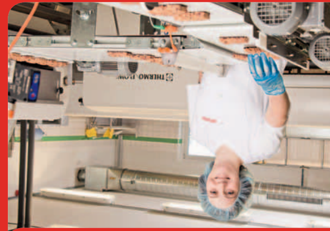
Fachkraft für Lebensmitteltechnik (w/m) Maschinen- und Anlagenführer (w/m)